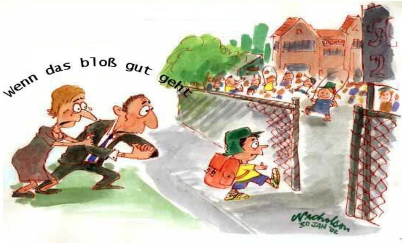
Gemeinschaftsschule Lauenburgische Seen: eine Schule für alle Kinder !